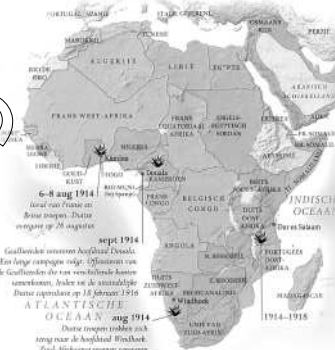
Oorlog in Afrika.