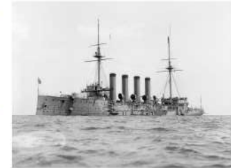
HMS HOGUE werd getorpedeerd door de U-9 terwijl ze probeerde overtevenen van de HMS Aboukir te reddien, 22 september 1914. © IWM (Q 21354)

doorgekomen. Op basis van de door beide boten verkregen inlichtingen kreeg onderzeeër SM U-9 van 'Kapiteinleutnant' Otto Weddigen, opdracht positie te kiezen voor de ingang van Het Kanaal tussen het Westhinder-lichtschip en Oostende. Dat was een nauwe doorgang die transportschepen vanuit Het Kanaal en vanuit de Theemsmonding moesten passeren om niet op de gevaarlijke zandbanken in de buurt te lopen. De duikbotenoorlog had zijn debuut gemaakt, al waren veel zaken nog zeer provisorisch. Deels als gevolg van deze nederlaag, maar ook omdat zijn Duitse afkomst publiek protest oopriep, werd admiraal prins Lodewijk van Battenberg afgezet als hoofd van de Royal Navy en vervangen door de veteraan admiraal 'Jacky' Fisher.