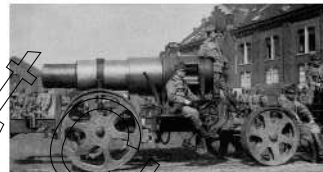
Oostenrijkse-Hongaarse Skoda-mortier van 30 cm in Brussel om later bij Antwerpen ingezet te worden.

Bron: M. VERLEYE EN M. DE MEYER, Augustus 1914, België op de vlucht, Antwerpen, Uitgeverij Manteau/WPG Uitgevers België nv, 2013, 232 p. L. DE VOS, T. SIMOENS, D. WARNIER, e.a. '14-'18 Oorlog in België, Leuven, Davidsfonds Uitgeverij n.v., 2014, 588 p. M. DE GEEST, Brave little Belgium. 13 verhalen over België in de Eerste Wereldoorlog, Antwerpen, Uitgeverij Manteau/WPG Uitgevers België nv, 2013, 384 p.