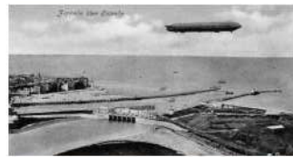
De gebeurtenissen met de zeppelin op 24 september 1914 boven Oostende, maakte in Duitsland veel ophef. Er werden enkele zichtkaarten uitgegeven met als onderwerp Oostende met in het luchtruim een zeppelin. We zien hier de havenveul en de Leopold spuiwolk met erboven een luchtschip in fotomontage.

sche bezetting 1914-1918, Oostende, Drukkerij Elleboudt, s.d., pp. 29-31. Vindplaats: Archief stad Oostende. E. Mahieu, Oostende in de Grote Oorlog, Gloucestershire, The History Press, 2011, p. 17. Vindplaats: Bibliotheek Kris Lambert Oostende