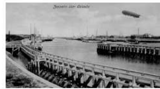
De Oostendse haven met een fotomontage van een zeppelin die boven de gebouwen aan het Zeewezend laaert. Links bemerken we het Zeestation.