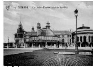
Het Kursaal.