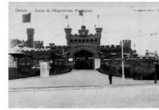
De Wellingtonhippodroom.