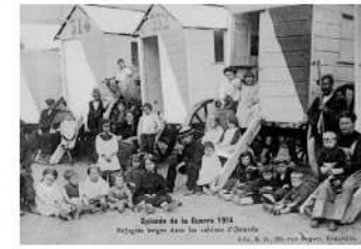
Het cabinedorp in Oostende.