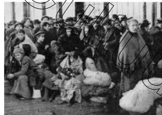
56. AT THE HARBOUR STATION, OSTENDE. Pige

Gebaseerd op het advies van het Officieel Comité heeft de Gemeenteraad van Oostende op 4 september enkele belangrijke en dringende beslissingen genomen om de vluchtelingen die in Oostende toekomen, beter te kunnen opvangen en te verzekeren van logeren en levensbehoeften. Dit is echter niet evident, vermits hun aantal steeds toeneemt.