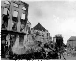
Eerste Wereldoorlog, De Grote Markt waar Belgische militairen voor het verwoeste Hotel Namur bivak hebben opgesteld. Dendermonde, België 1914.

Van 26 tot en met 31 augustus - Slag bij Tannenbergh. De Duitse troepen stoten buiten Tannenbergh op Samsonovs leger. Op 29 augustus is Samsonov omsingeld. De pogingen van Rennenkampf om Samsonovs troepen te hulp te komen draaien op niets uit. De Russen lijden enorme verliezen en hun invasie in Oost-Pruisen is definitief vernield. Het Franse en Britse vertrouwen in hun bondgenoot op het oostfront is door de vernietigende nederlaag ernstig geschoonden. De Duitsers komen versterkt uit de strijd.