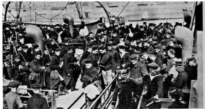
Vesting Namen, verdedigd door de troepen van de 4de Legerafdeling, valt op 25 augustus 1914. Afgesneden van het veldleger, dat zich terugtrekt op de nationale Vesting Antwerpen, worden de overblijvende soldaten op transport gezet naar Le Havre. Van daaruit vertrekken op 1 en 2 september 1914 de niet-bereden troepen met onder andere de maalboot Princesse Clementine naar Oostende en Zeebrugge. We zien de soldaten aan wal komen, om een paar dagen later per spoor overgebracht te worden naar Antwerpen waar ze de rest van het Belgische leger vervoegen.

5 september. De Duitsers branden een groot deel van Dendermonde plat waarbij de helft van de huizen volledig wordt vernield. Enkel de gotische Onze-Lieve-Vrouwekerk en het Vleeshuis op de Grote Markt blijven overeind staan. Veel inwoners zijn gedepoteerd naar Duitsland. In Lebbeke en Sint-Gillis worden 25 inwoners vermoord door het voorbijtrekkende Duitse leger.